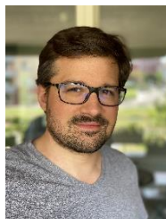
Martin Panchaud © Edition Moderne

Né à Genève en 1982, Martin Panchaud est un graphiste, auteur et illustrateur basé à Zurich. En 2016, il a publié une adaptation illustrée de l'épisode IV de Star Wars d'une longueur de 123 mètres. Ce travail lui a valu la reconnaissance de diverses institutions culturelles en Europe.